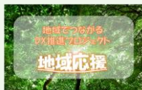
【申込受付中】地域応援プロジェクト 参加申し込み受付中