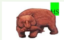
【企業紹介】株式会社北海道なまら札幌