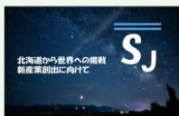
【セミナー】北海道の新産業創出に向けたオンラインセミナー