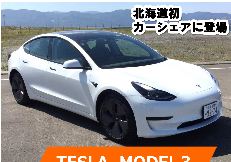
TESLA MODEL 3