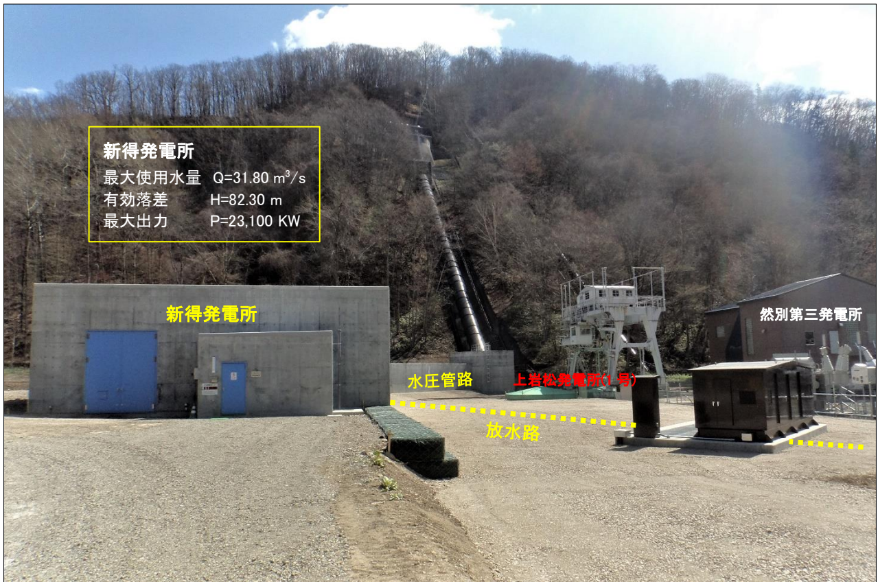
【 発電所外観 】