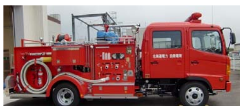
化学消防車（平成 20 年 3 月配備済み）