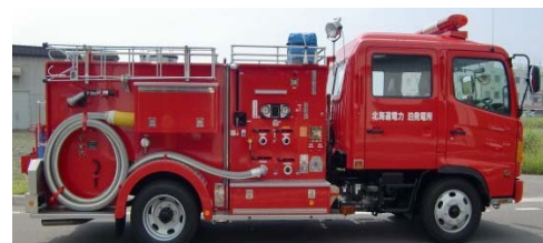
水槽付消防車（平成 20 年 3 月配備済み）