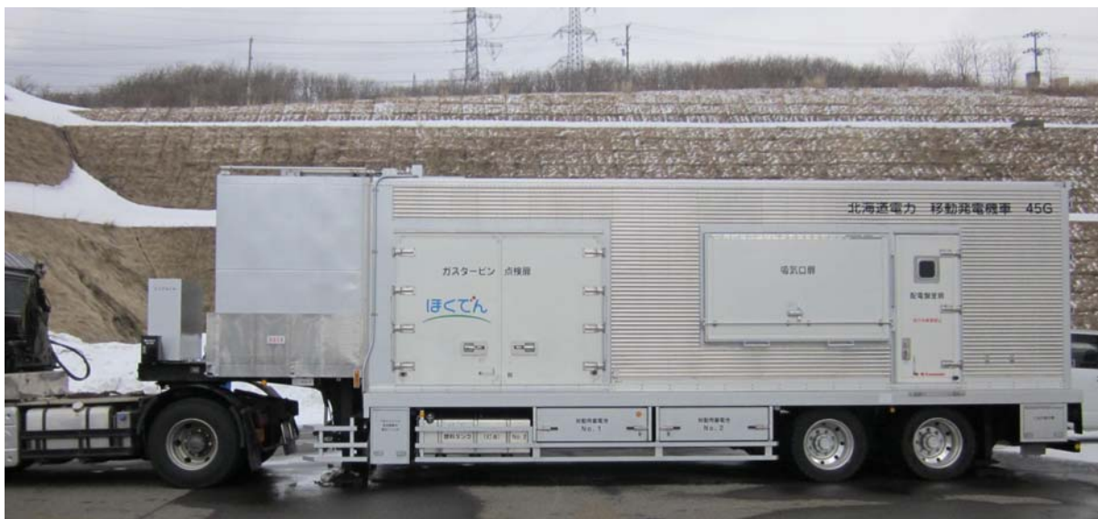
移動発電機車（平成 23 年 3 月 18 日配備済み）