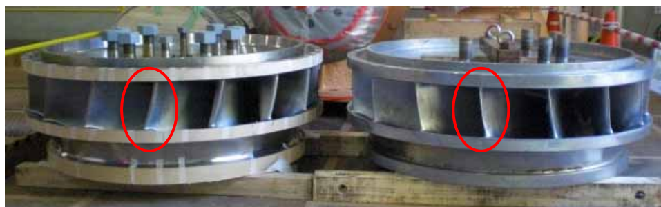
層雲峡発電所で採用された新型水車ランナ（左）と旧水車ランナ（右）

羽の形状と水の流れ・圧力を条件に解析し、羽の形・厚さ・角度を最適化することで効率が上がる。また、損失エネルギーを減らしたことで、水車の損傷も減少。