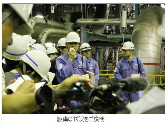
設備の状況をご説明