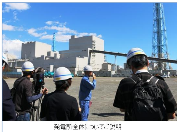
発電所全体についてご説明