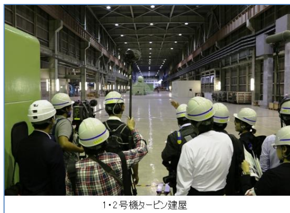
1・2号機タービン建屋