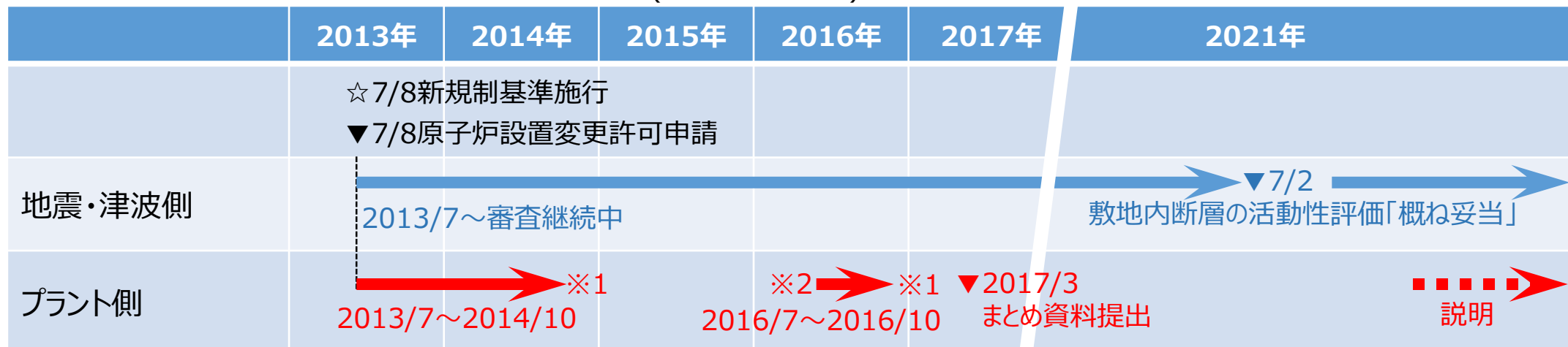
泊発電所3号炉 新規制基準適合性審査の経緯(審査会合の期間)